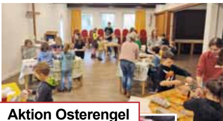
Aktion Osterengel Osterallerlei