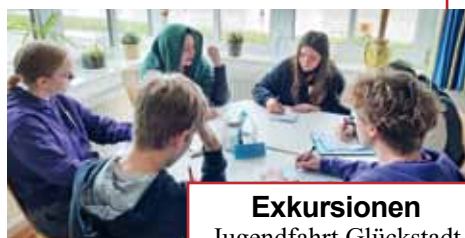
Exkursionen Jugendfahrt Glückstadt